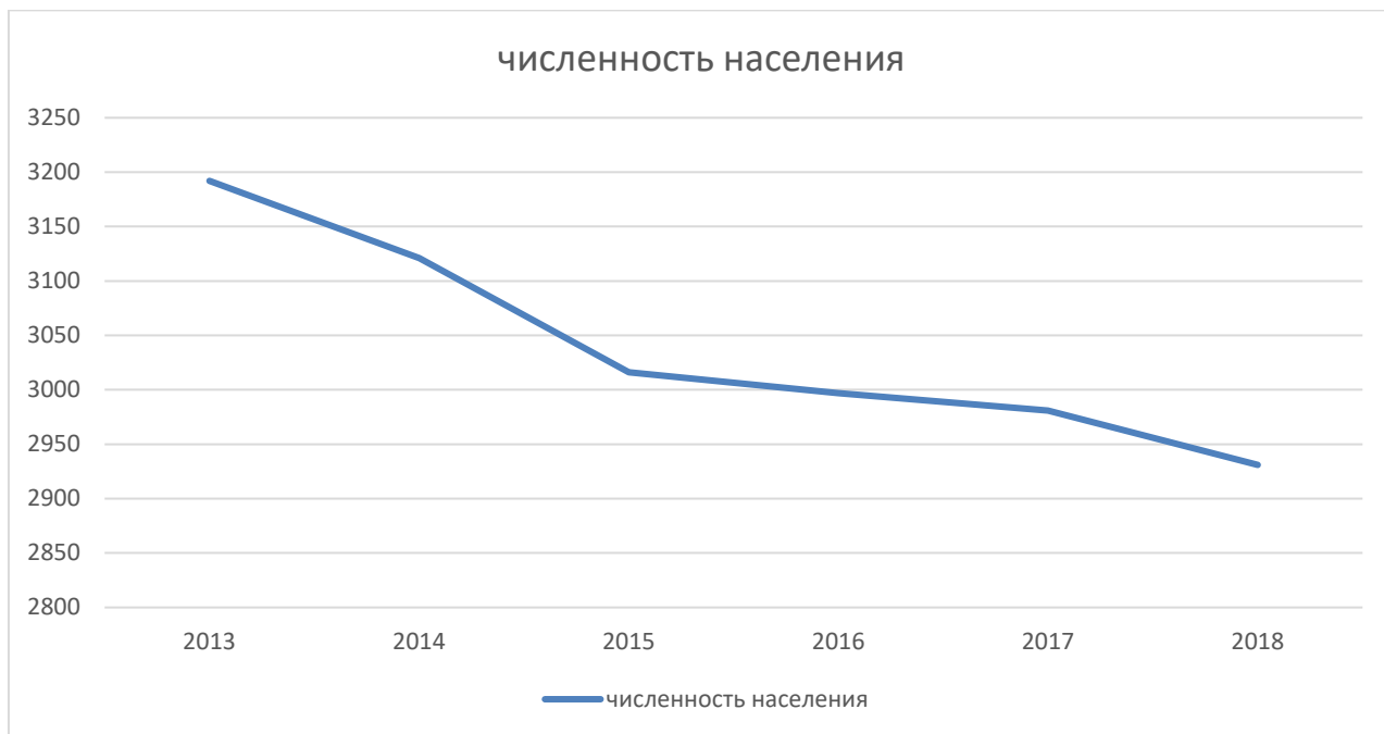
Рисунок 2 Динамика численности населения Анненского сельского поселения

Площадь, занимаемая городским поселением, составляет 41200 га.