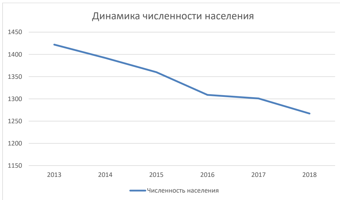
Рисунок 2 Динамика численности Неплюевского сельского населения

Площадь, занимаемая сельским поселением, составляет 36168 га.